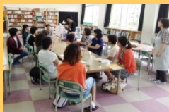
2学期のミーティング

26年度からは保護者の皆さんがたくさん協力して下さるようになりました。学期に一度、ミーティングを開き、交流しながら次の当番表を作成し自主的に活動して下さいます。