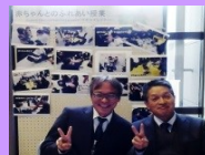
「勉強ワクワク」フォーラムII